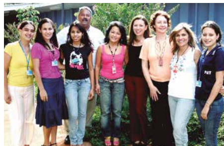
COM A EQUIPE DA RHDA.AD, NA DESPEDIDA DA EMPRESA

Hoje ela vive em Guarapari/ES e colhe os frutos do dever cumprido. E para isso, também conta com a Fibra. “A Fundação tem um papel importante em minha vida. Graças a ela tenho estabilidade financeira e oportunidades de investimento em minha qualidade de vida. Me sinto privilegiada. Ganho