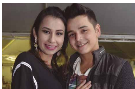
COM A ESPOSA