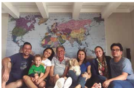
COM A FAMÍLIA

“Eu não imaginava que trabalharia na Itaipu, as coisas foram acontecendo. Eu tinha estagiado na Companhia Auxiliar Empresas Elétricas Brasileiras (CAEEB), no Rio, e quando concluí o curso na UFRJ, assumi o cargo de Psicóloga na CAEEB, mas em Foz do Iguaçu. Em janeiro de 1978 comecei a minha história na Itaipu, história de que tanto me orgulho”, diz ela.