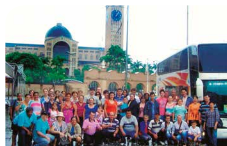
Romaria para Aparecida do Norte (SP)

bom, tenho facilidade para aprender, então sempre deu certo. Agora trabalho com turismo de romaria, viajo até duas vezes por mês tomando conta de pessoas idosas. Meu marido, também aposentado, vai junto, ele toca violão e nos divertimos, faço amizades e ainda ganho uns trocados”, comenta.