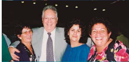
Comemoração de 15 anos de trabalho