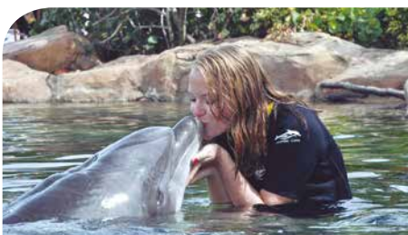
Em Orlando, Florida, na época do intercâmbio, 2010.

trabalhou três anos e meio na Companhia de Habitação do Paraná (Cohapar) – Regional de Campo Mourão, empresa que só deixou para fazer um ano de intercâmbio em Chicago – Illinois, onde fez créditos acadêmicos de conversação e redação em língua inglesa, no College of DuPage. Em São Paulo ela também aproveitou para fazer cursos e treinamentos na área de Licitação, visando sempre uma qualificação melhor.